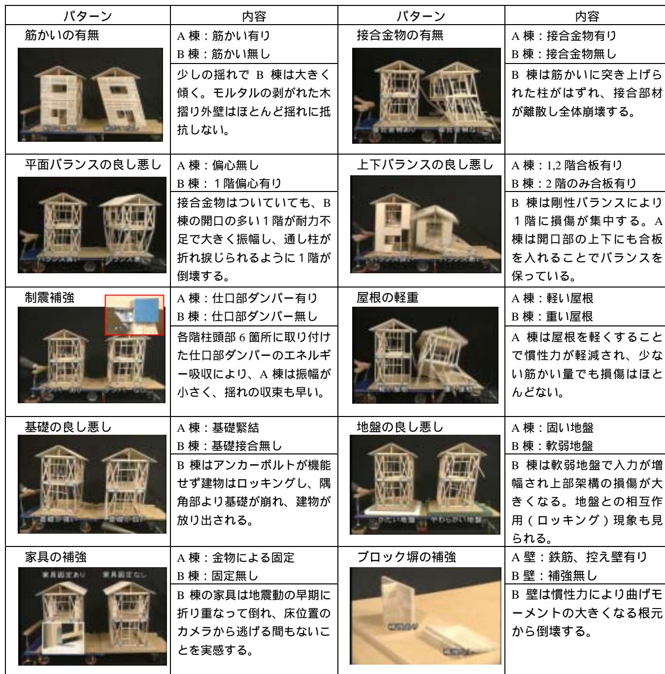
表 3 実験パターン