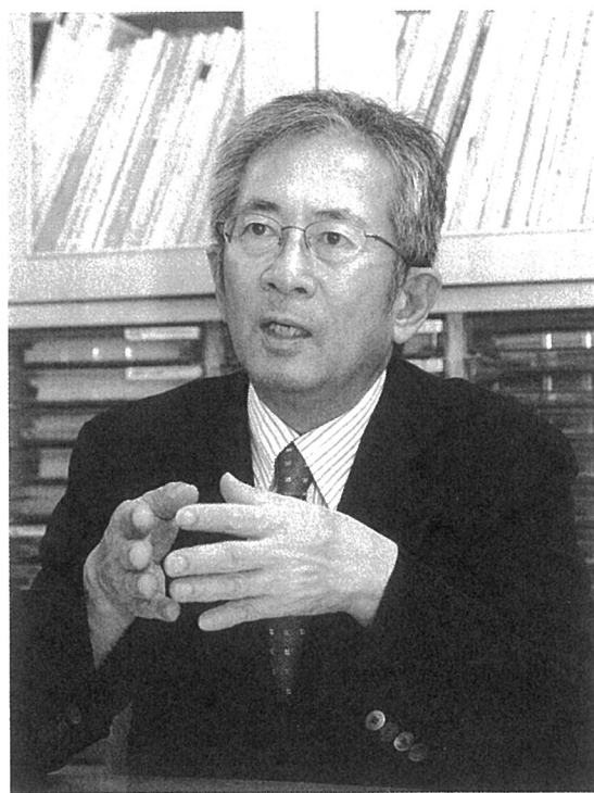
（ふくわのぶお）1981年名古屋大学大学院工学研究科修了後、大手ゼネコンの研究室に勤務。'91年名古屋大学工学部助教授に就任。同大学先端技術共同研究センター教授、同大学院環境学研究科教授を経て2012年より、現職。名古屋を拠点に各地の防災対策に協力しつつ、災害被害軽減に有効となる「減災社会」の実現、そのための人材育成に取り組む。

「想定外」の災害が生じることもあるが、多くはこれまでの災害の歴史、当時の人々の暮らしぶりをひもとけば、減災対策に生かせる教訓にたどりつく。過去の体験を無駄にすることなく、減災対策を実現するた