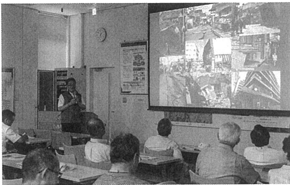
開館日には誰でも参加できる「ギャラリートーク」(講演会)が行われる。